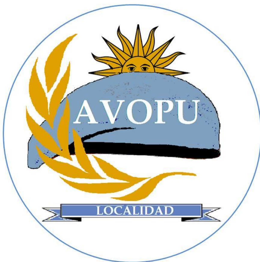
Figura Nº 2: Emblema de la Asociación para uso de las filiales o representaciones.