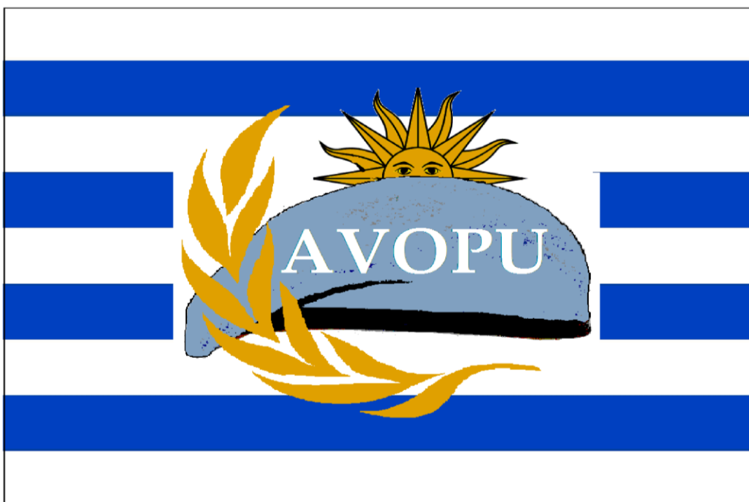
Figura N° 3: Bandera de la Asociación.